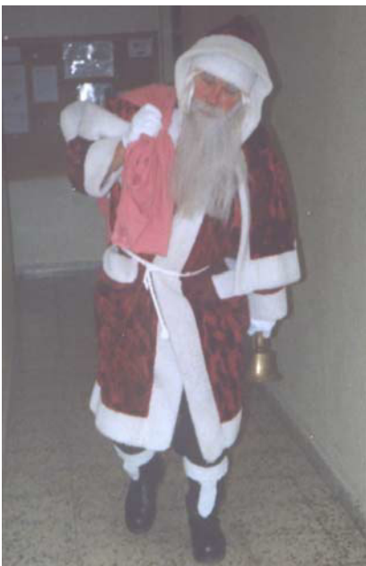
Ein nobler Weihnachtsmann beschenkte die Sportler.