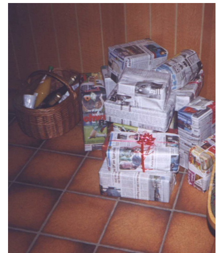
Ein Berg voller Schrottpakete.