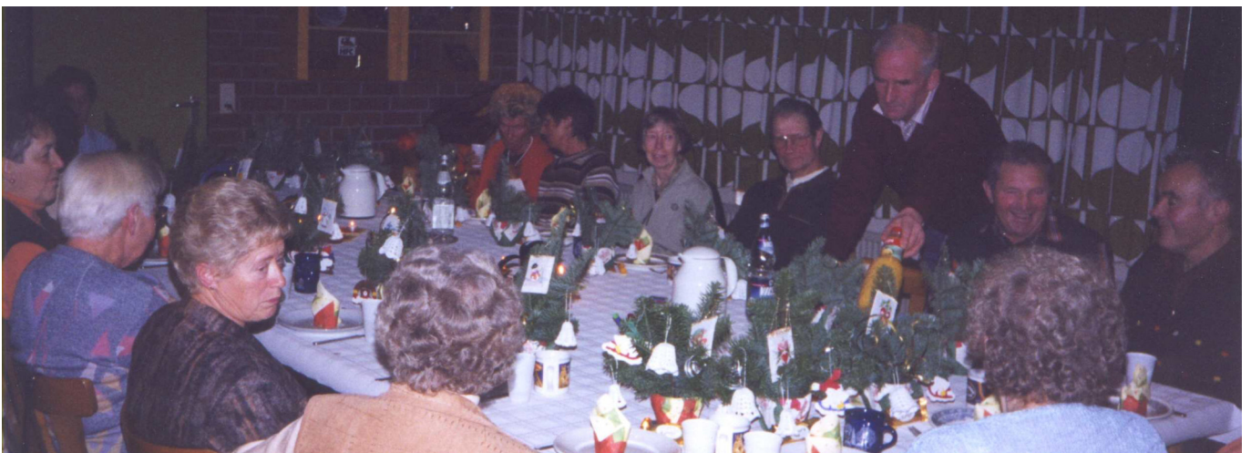
Die festlich geschmückte Weihnachtstafel.

Die Gruppe würde sich auch im neuen Jahr wieder über neue Gesichter freuen, die Spaß am Sport und der Geselligkeit haben.